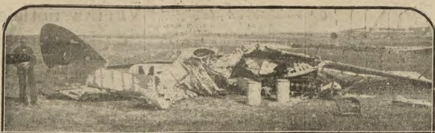
MADRID.—Estado en que quedó el aeroplano en el que encontró ayer la muerte el teniente Osuna, después de la caída.