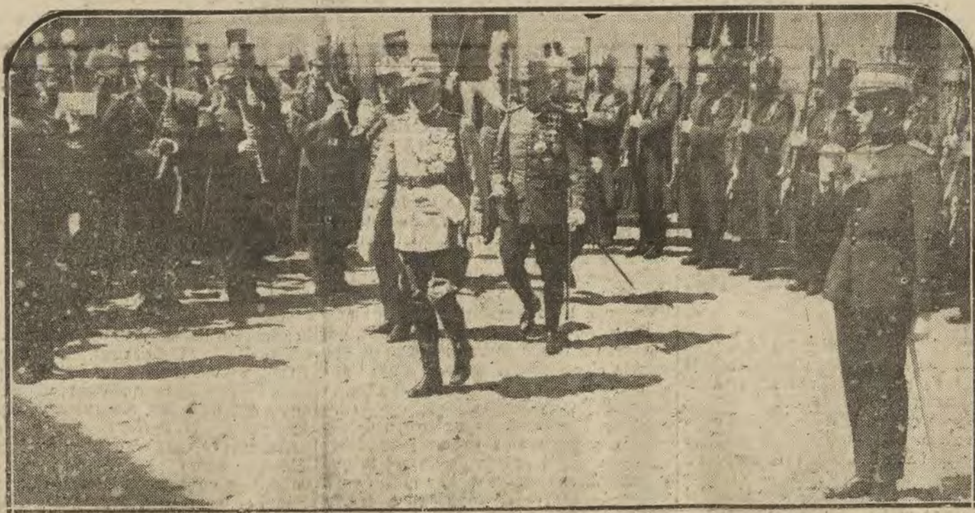
MADRID.—En el cuartel del Conde-Duque. El generalísimo italiano Díaz, revistando al Regimiento de Saboya, del cual es coronel honorario el Rey de Italia.

Publicación de artículos industriales. Reclamos, Comunicados, Anuncios en vallas, teatros, etc. Esquemas de decoración, novenario y aniversario, etc. en los periódicos de Madrid, provincias y extranjero. OFICINAS DE PUBLICIDAD PLAZA DE MAYOR, 8, primero izquierdo TELEFONO 2.895-M