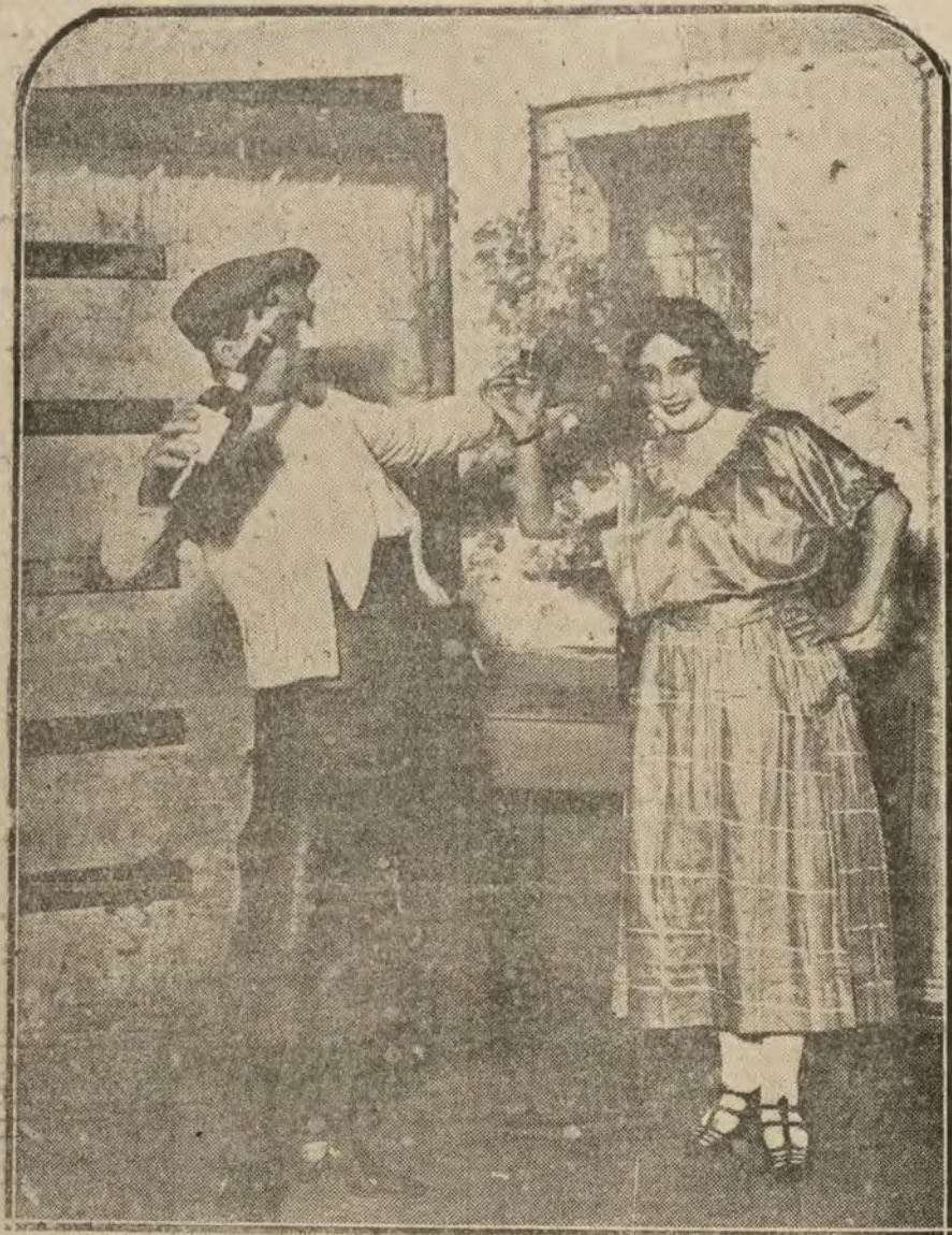
MADRID.—Una escena de «Suerte que tiene una», de Casado y Sánchez Carre, que se estrena esta noche en el teatro Novedades.