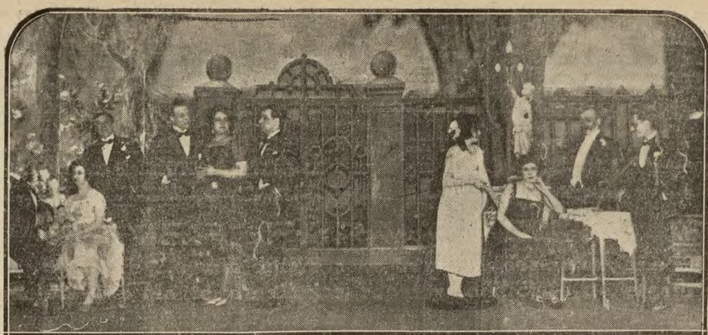
MADRID.—Una escena de la comedia en tres actos «Rebeldes», estrenada ayer en el teatro Español. (Foto Vidal).