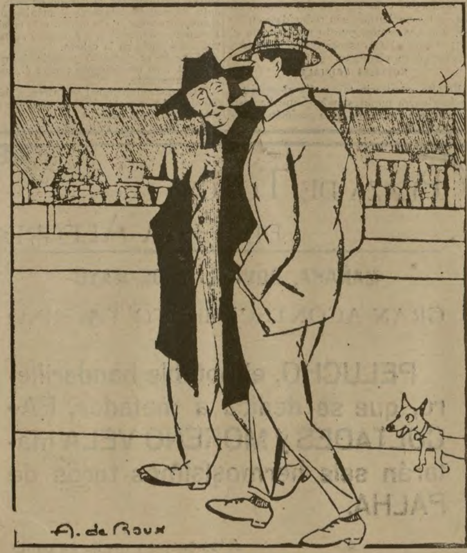
PREVISION —¿Qué esperas para pagar la contribución? —Espero... que la rebajen.