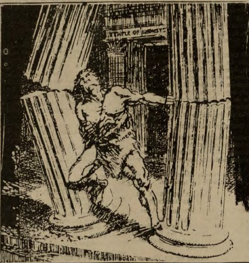
Lashu elgas inglesas o Sansón ciego.