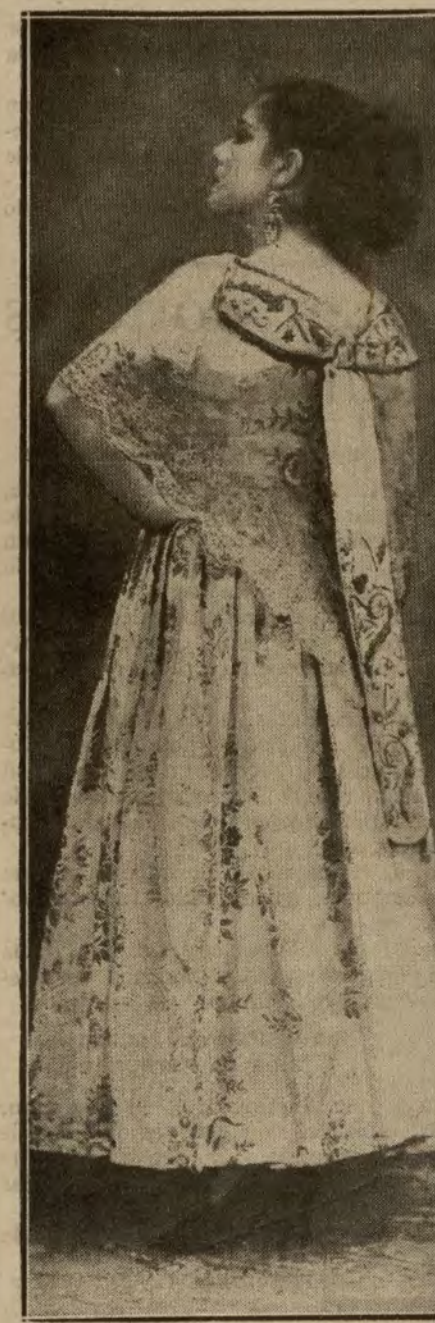
RAQUEL MELLER eminente artista, que ha debutado con extraordinario éxito en Madrid Cinema.

—Estreno de «No más calvos!», apunte de sainete de Pacheco y Candela, por la compañía de Lara; «Chiquita y bonita».