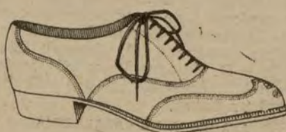
Zapatos de oscaría color, clase extra. De ptas. 31 a 57.

Barcelona, Alicante, Almería, Bilbao, Cádiz, Cartagena, Gijón, Granada, Málaga, Palma de Mallorca, Santander, Sevilla, Valencia, Valladolid, Zaragoza.