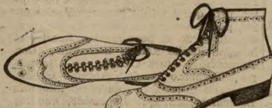
Borceguies becerro, en negro y color. De ptas. 24 a 50.