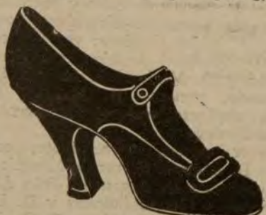
Zapatos terciopelo, clase primera. De ptas. 18,50 a 25.