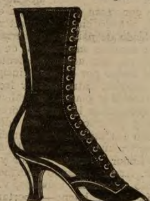
Borceguies dónbola superior. A ptas. 22.