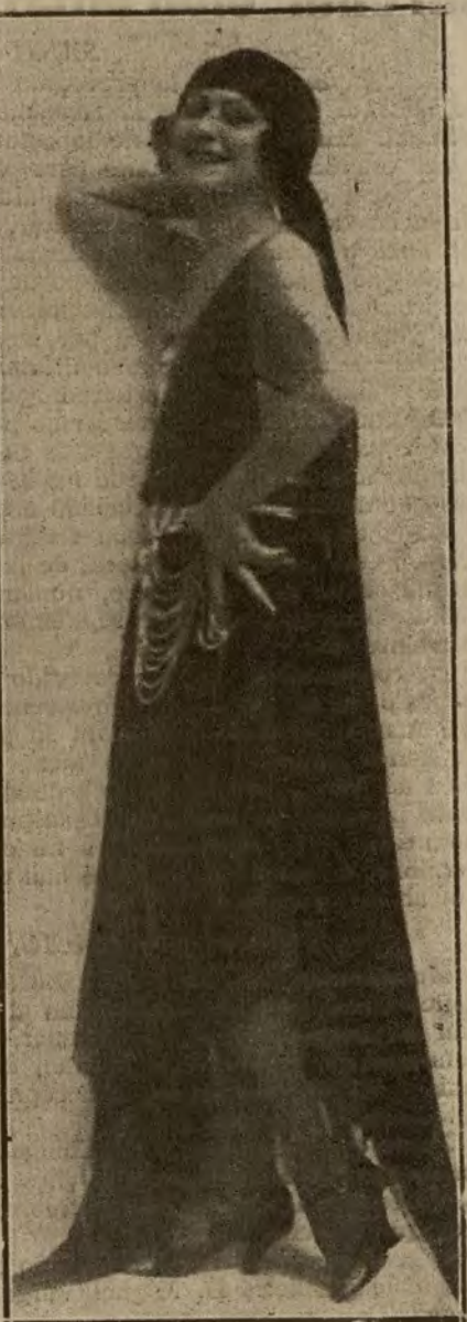
EVAN STACHINO, LA ELEGANTÍSIMA ESTRELLA MEXICANA, QUE AL PRESENTARSE AL PÚBLICO ESPAÑOL EN EL GRAN CASINO, DE SAN SEBASTIÁN, HA LOGRADO UN CLAMOROSO TRIUNFO

Parece ser que las nuevas bandas—que llamaremos vodevilesas—se dedican a secuestrar señoras.