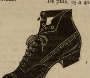
Borceguí oscaría negra. De ptas. 19 a 40.