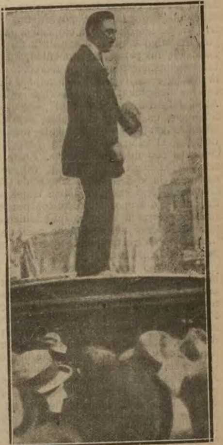
LA HUELGA INTERMINABLE. UN DELEGADO DE LOS MINEROS INGLESES PRONUNCIANDO UN DISCURSO EN LA PLAZA PUBLICA