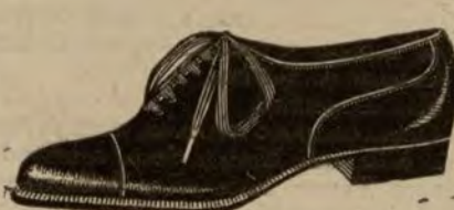
Zapatos de oscaría negra, clase extra. De ptas. 18 a 37.