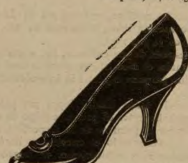
Zapatos petro charol, tacón forrado. De ptas. 25 a 40.