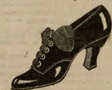
Zapatos dónbola negra y charol. De ptas. 14 a 25.