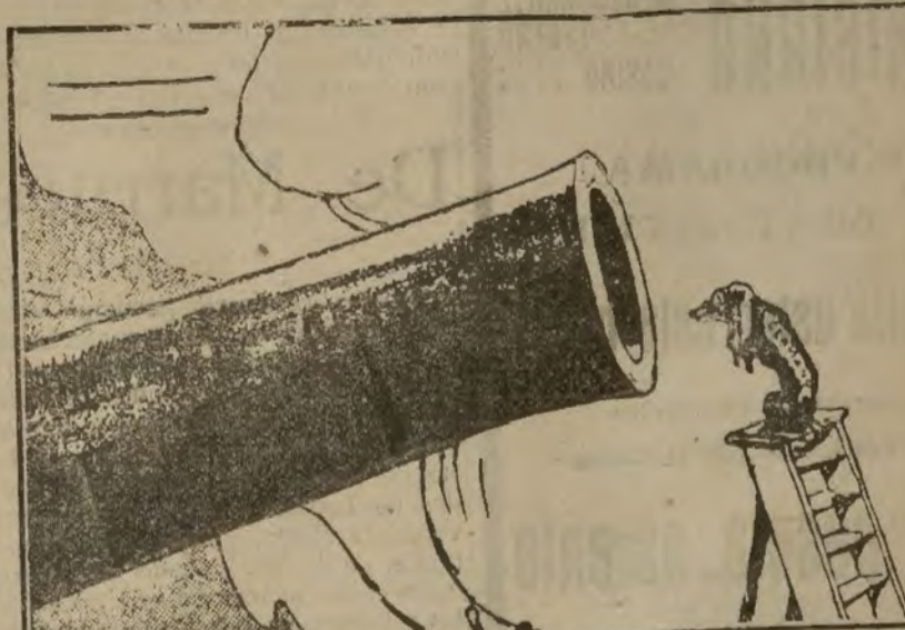
ALEMANIA Y LOS ALIADOS. —La voz de su amo. (Del London Opinion).