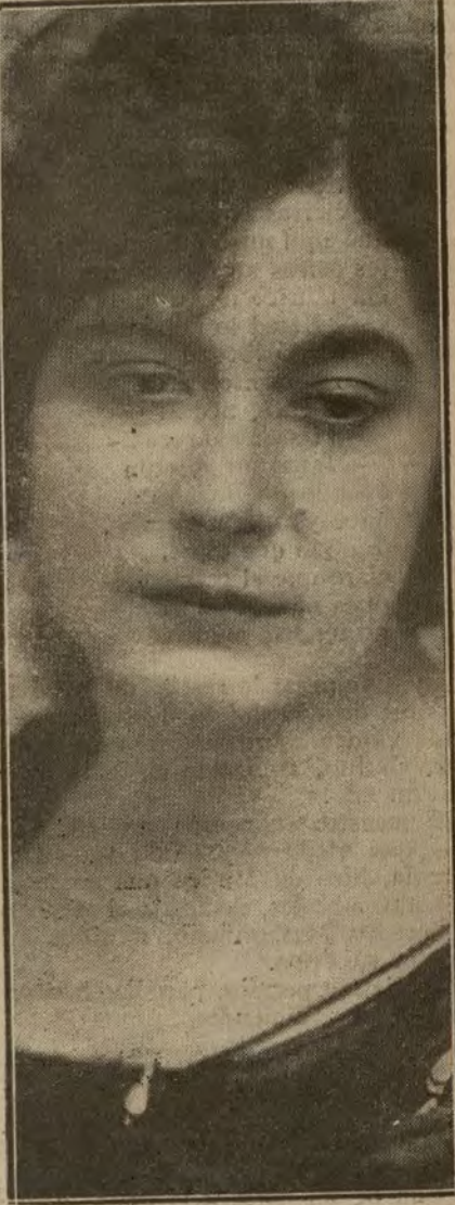
LA GENIAL MARGARITA XIRGU, QUE, DESPUES DE TRIUNFAR RUIDOSAMENTE EN SEVILLA, SE DISPONE A RECORRER LAS PRINCIPALES POBLACIONES ESPAÑOLAS Y VENIR EN OTONO A MADRID, ANTES DE SALIR PARA AMERICA

Se espera con gran interés que toda la banda caiga en poder de la Policía, pero es objeto de muchos comentarios la negligencia de los policías del distrito de la calle del Olmo, no realizando el servicio que estaba preparado, pues de seguro que hubieran podido ser detenidos todos los afiliados, y el terrorismo y el sindicalismo hubieran sufrido un rudo golpe.