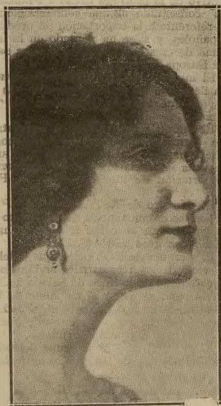
LA BELLA Y NOTABLE ACTRIZ IRENE LÓPEZ HEREDIA, QUE SEGÚN LAS ÚLTIMAS NOTICIAS, VUELVE A COMPARTIR LOS ÉXITOS TEATRALES CON ERNESTO VILCHES