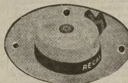
Bateras de paja semiinglesa, gran novedad, clase primera. De ptas. 10,50 a 15.