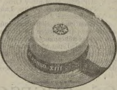
Bateras de paja auténtica, cinta color azul. A ptas. 4,75.