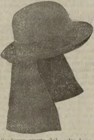
Sombreros «sports» dril, color beige, gran surtido. A ptas. 6,75.