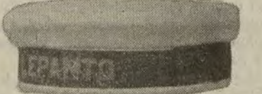
Gorras marinero, varios modelos, en dril blanco, lavables. A ptas. 3 y 6.