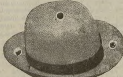
Sombreros jipis, clases muy finas. De ptas. 25 a 60.