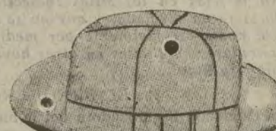
Sombreros de dril blanco, clase superior. A ptas. 6.