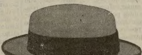
Sombreros de piqué para señorita, varias modelos. A ptas. 12 y 15.