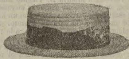
Sombreros de paja, alta novedad, clase superior. De ptas. 5.50 a 14.

Barcelona, Alicante, Almería, Bilbao, Cádiz, Cartagena, Gijón, Granada, Málaga, Palma de Mallorca, Santander, Sevilla, Valencia, Valladolid, Zaragoza.