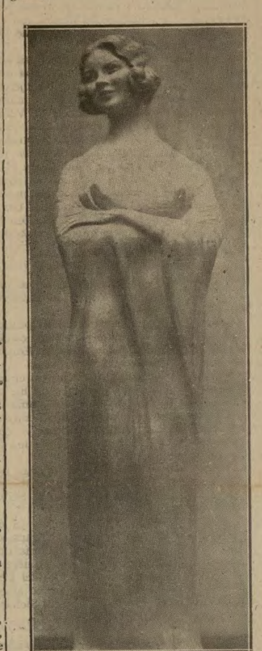
«CELIA», UNO DE LOS MAYORES ACIERTOS DE SEBASTIAN MIRANDA