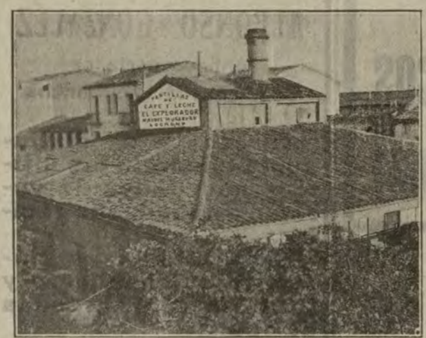
VISTA EXTERIOR DE LA FABRICA