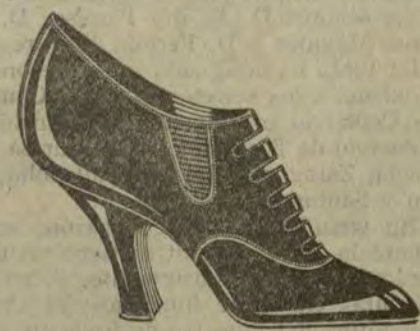
Zapatos charol, gran novedad y elegancia.