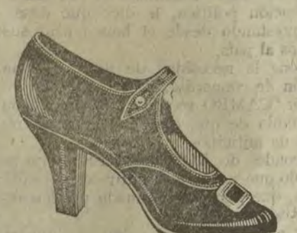
Zapatos charol, en tacón de 8 y medio y 6 centímetros.