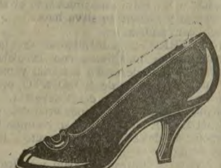
Zapato potro, charol, tacón formado.