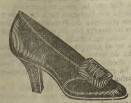
Zapatos dónola, hebilla de azabache, clase primera.