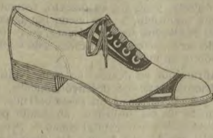
Zapatos de lona blanca, adornos charol o becerro color.