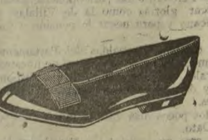
Zapatos de charol para caballero.