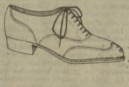
Zapatos becerro americano y patas en negro y color.