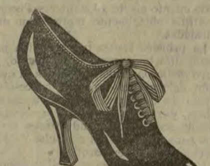
Zapatos charol corte una pieza.