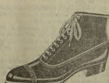
Barcoques de oscuria negra, clase extra.