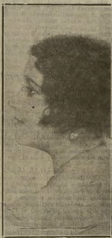
LA HERMOSA Y APLAUDIDA TIPLÉ ROSARÍO LEÓNIS, QUE ESTA NOCHE CELEBRA EN APOLO SU BENEFICIO

men de las liquidaciones, catorce o quince temporeros, pues mensualmente se despiden en la calle del Prado, unas 400 liquidaciones. Así que, como hay que contar unos dieciocho años, ¡calcule usted!