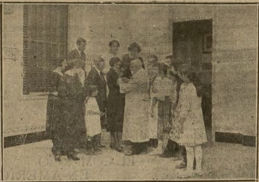
EL DOCTOR FERRAN INOCULANDO, EN SU INSTITUTO DE BARCELONA, CONTRA LA TUBERCULOSIS

Si sus vacunas contra el cólera, tífus y tuberculosis, los ejércitos y los pueblos