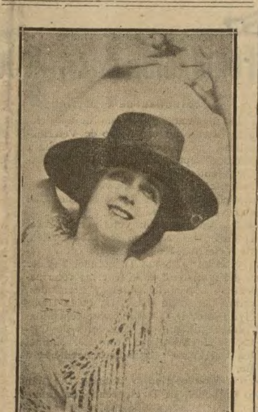
NERINA, EXCELENTE Y CASTIZA COMO BAILARINA Y BELLISIMA COMO MUJER

Parece que el explosivo que estalló en el arroyo de los Angeles estaba destinado al domicilio del presidente de la Federación Patronal.