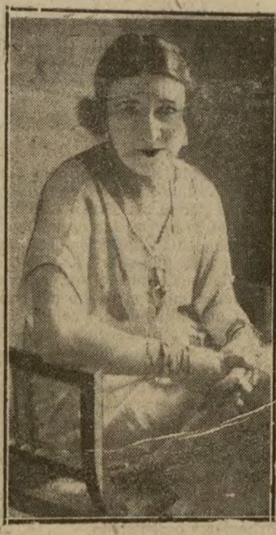
AURORA JAUFRET (LA GOYA), EMINENTE CANCIONISTA, QUE ACABA DE REGRESAR DE MEJICO, DONDE HA OBTENIDO GRANDES ÉXITOS

Infinitas son las versiones que hay sobre el punto donde nació Rodrigo Díaz de Vivar, más conocido en la Historia por el Cid Campeador.