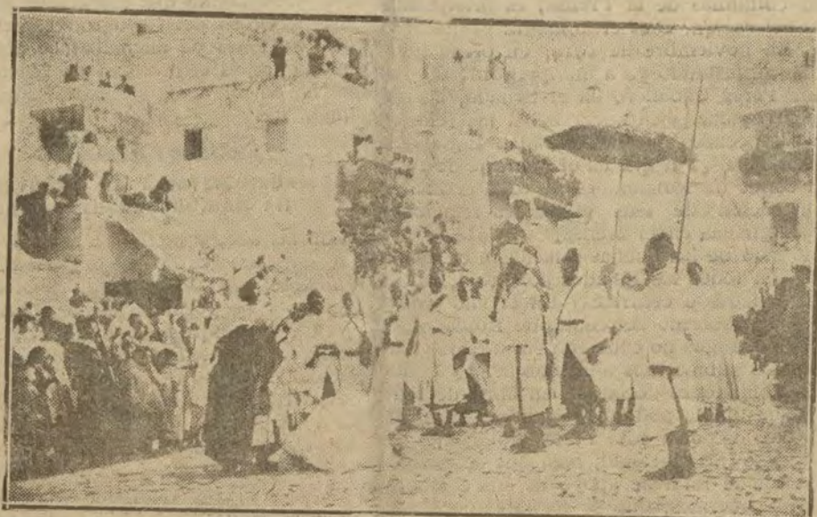
LA VIDA EN MARRUECOS

Enviamos nuestro sentido pésame a toda su familia por pérdida tan sensible.