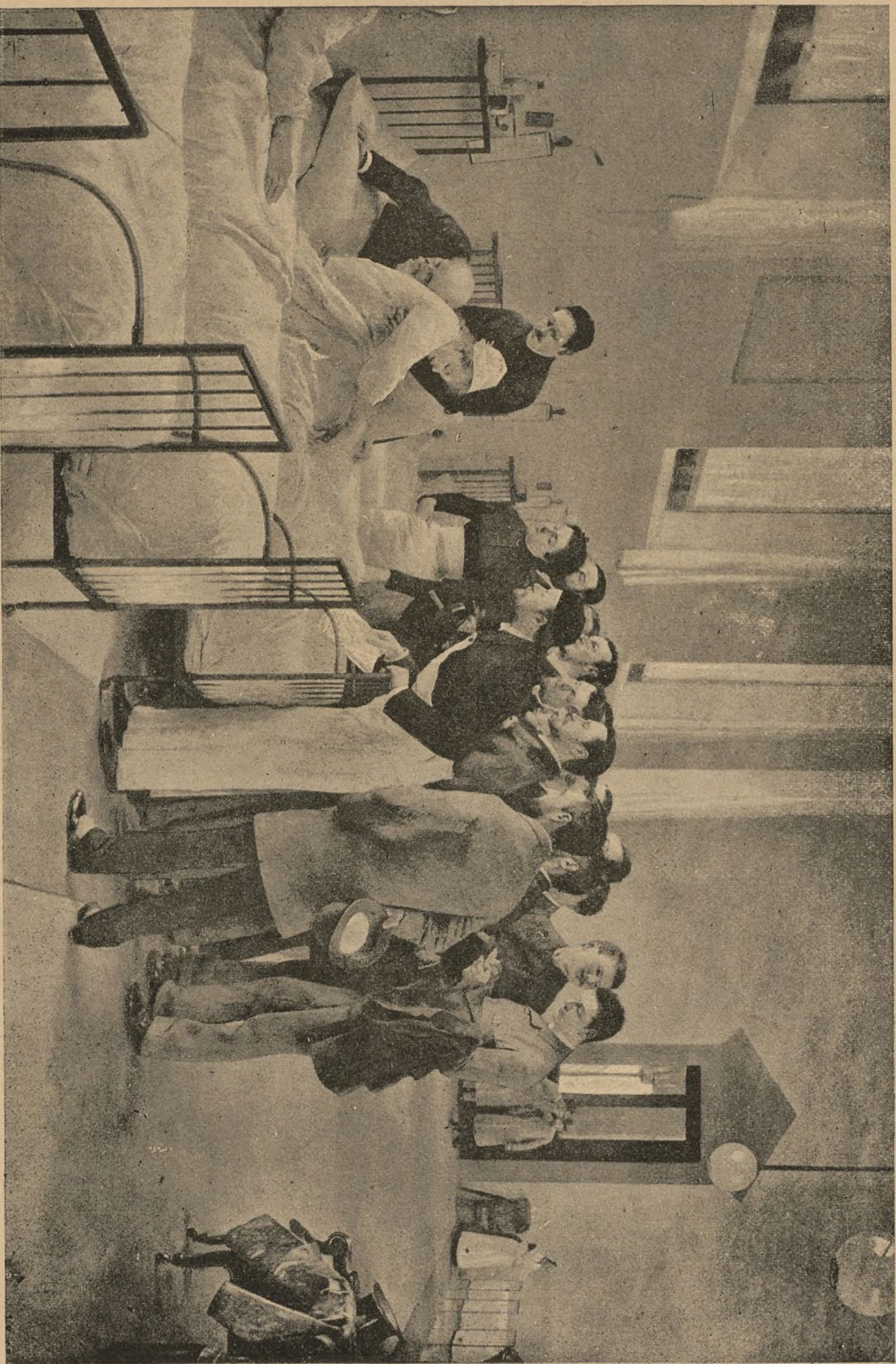
LA VISITA DEL MÉDICO EN LA CLÍNICA