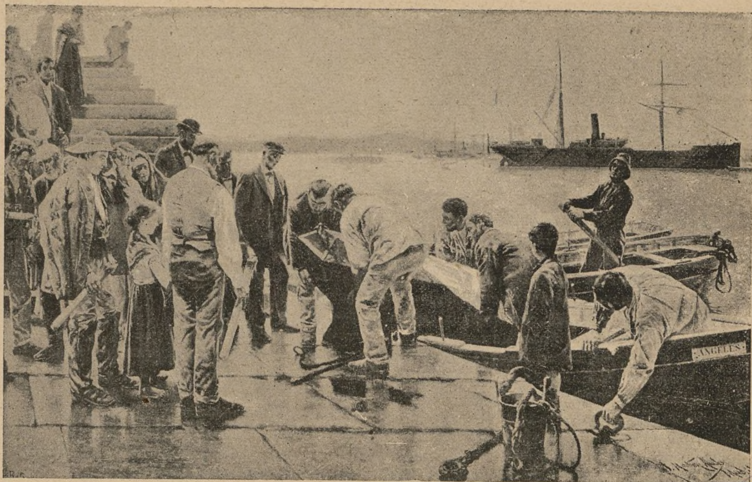
EL ENTIERRO DEL PILOTO (CUADRO DE D. JUAN MARTÍNEZ ABADES)

—No es posible; el comedor es lo primero que va allá, porque yo tiro á que comamos en la nueva casa esta noche misma.