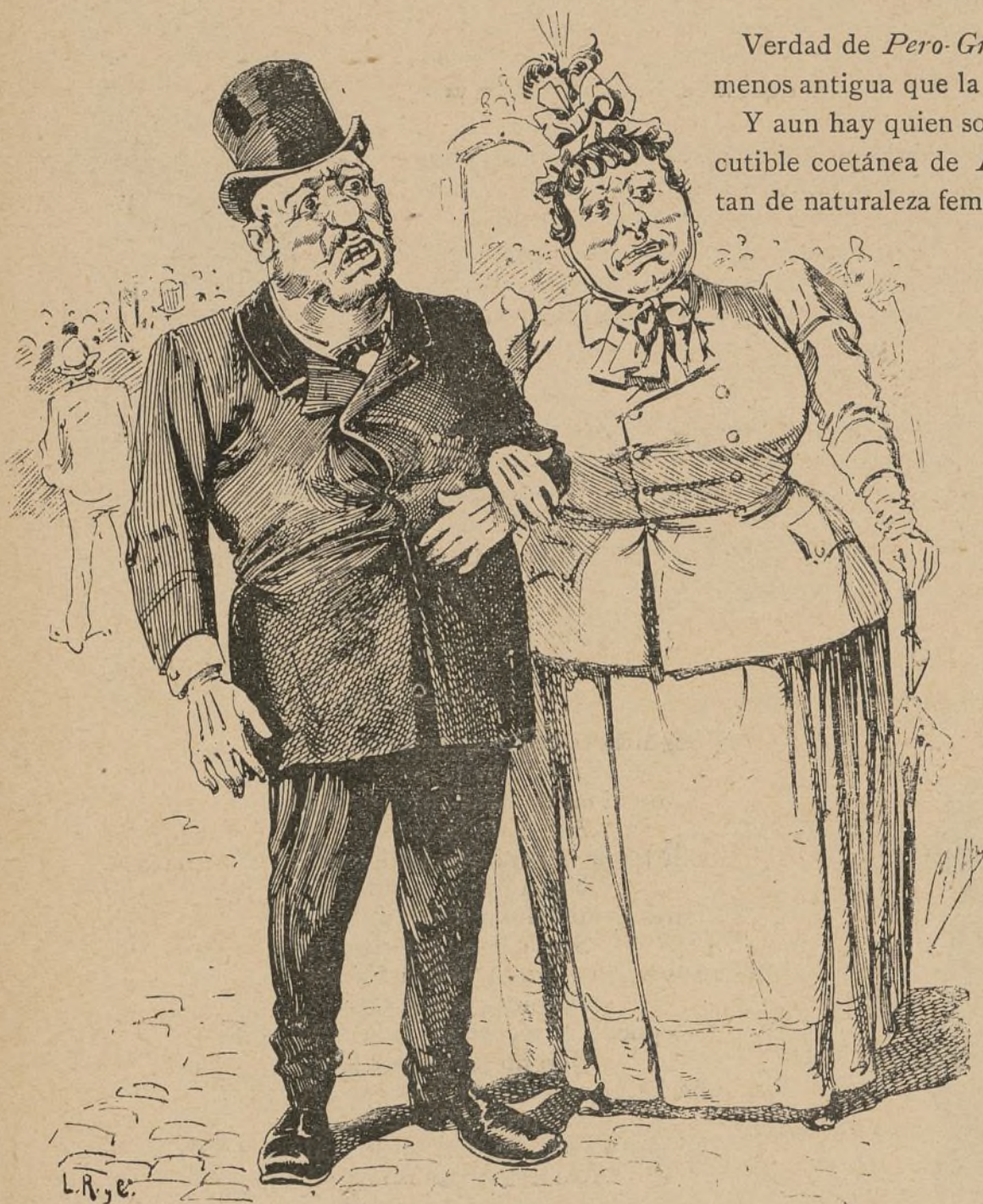
Un matrimonio á la última moda.

Verdad de Pero-Grullo es la de que la Moda es poco menos antigua que la humanidad.