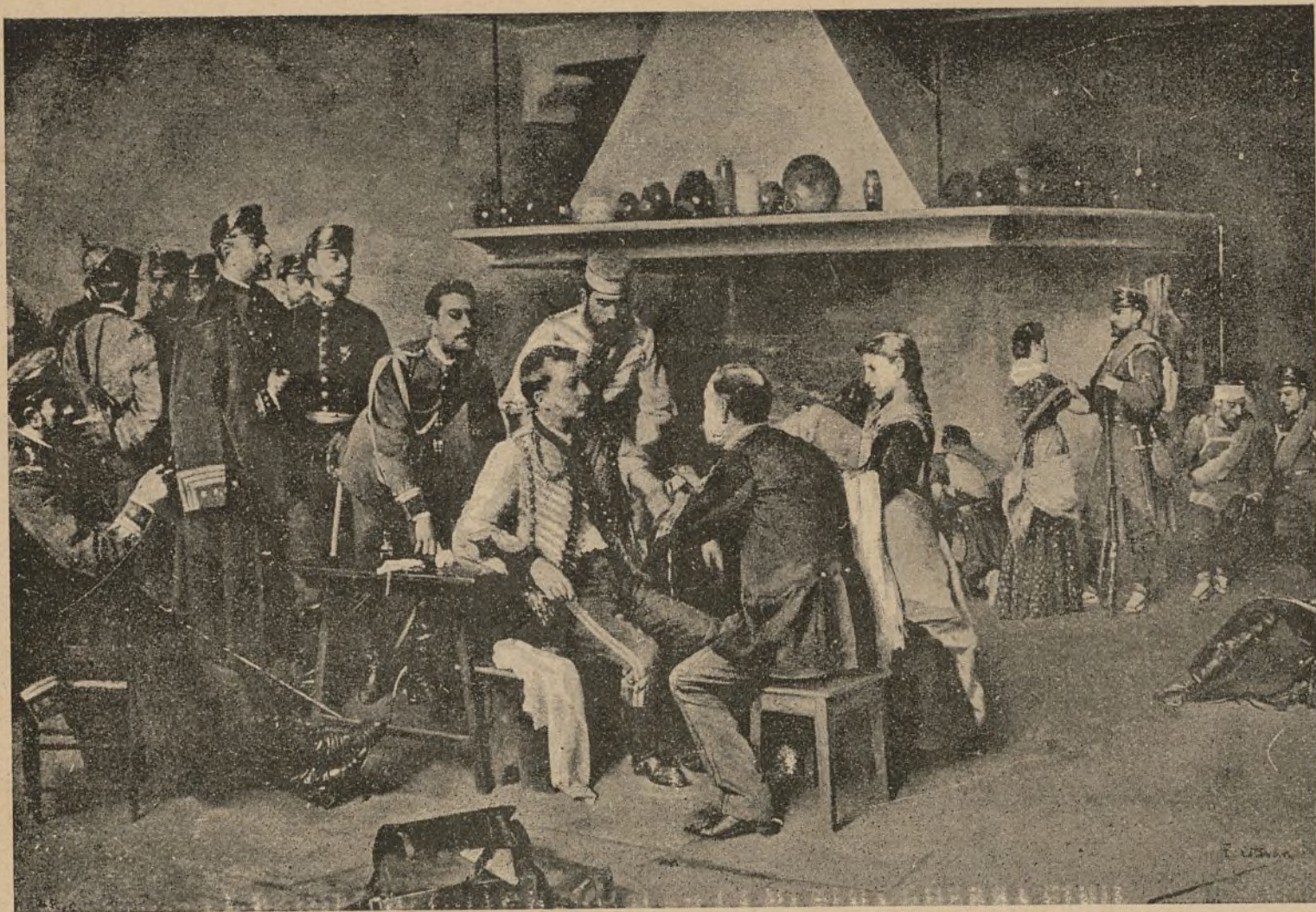
EL PRIMER OFICIAL HERIDO EN LA ÚLTIMA GUERRA CIVIL