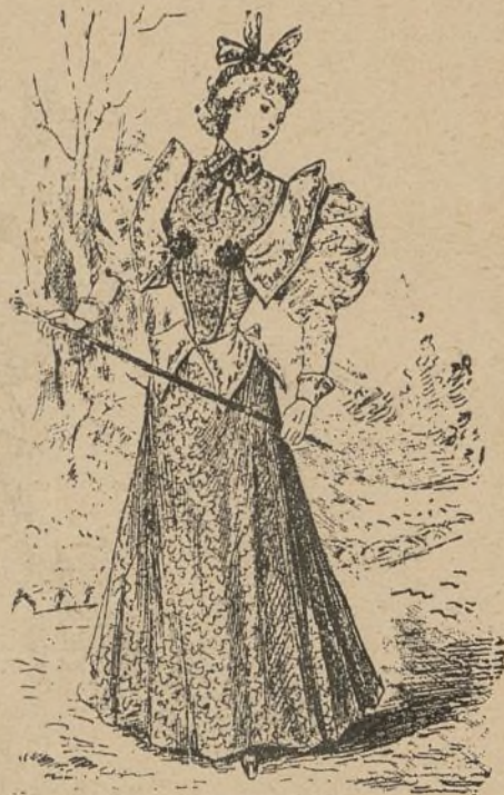
Vestido de paseo.

de lana fantasía, con adornos de terciopelo verde musgo. Falda de campana amplia, así como la manga, de bullón, puños, bertas y aldetas del cuerpo en terciopelo.