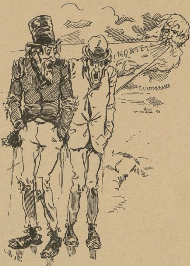
¡Qué situación la de los españoles!