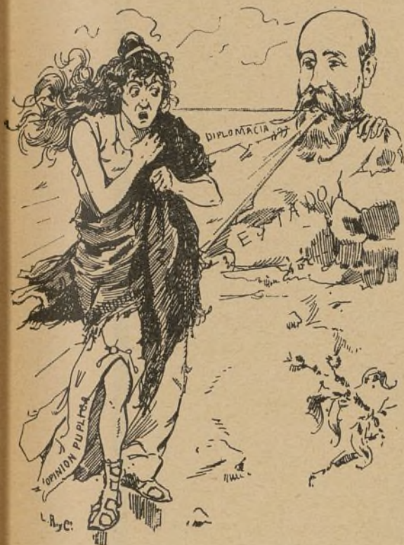
¡Qué situación la de España!