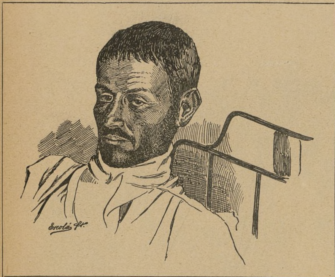
EL ANARQUISTA SALVADOR, QUE SE HA CONFESADO AUTOR DEL HORRIBLE ATENTADO COMETIDO EN EL GRAN TEATRO DEL LICEO DE BARCELONA.