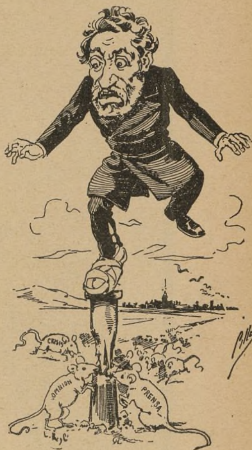
¡Qué situación la del Presidente!