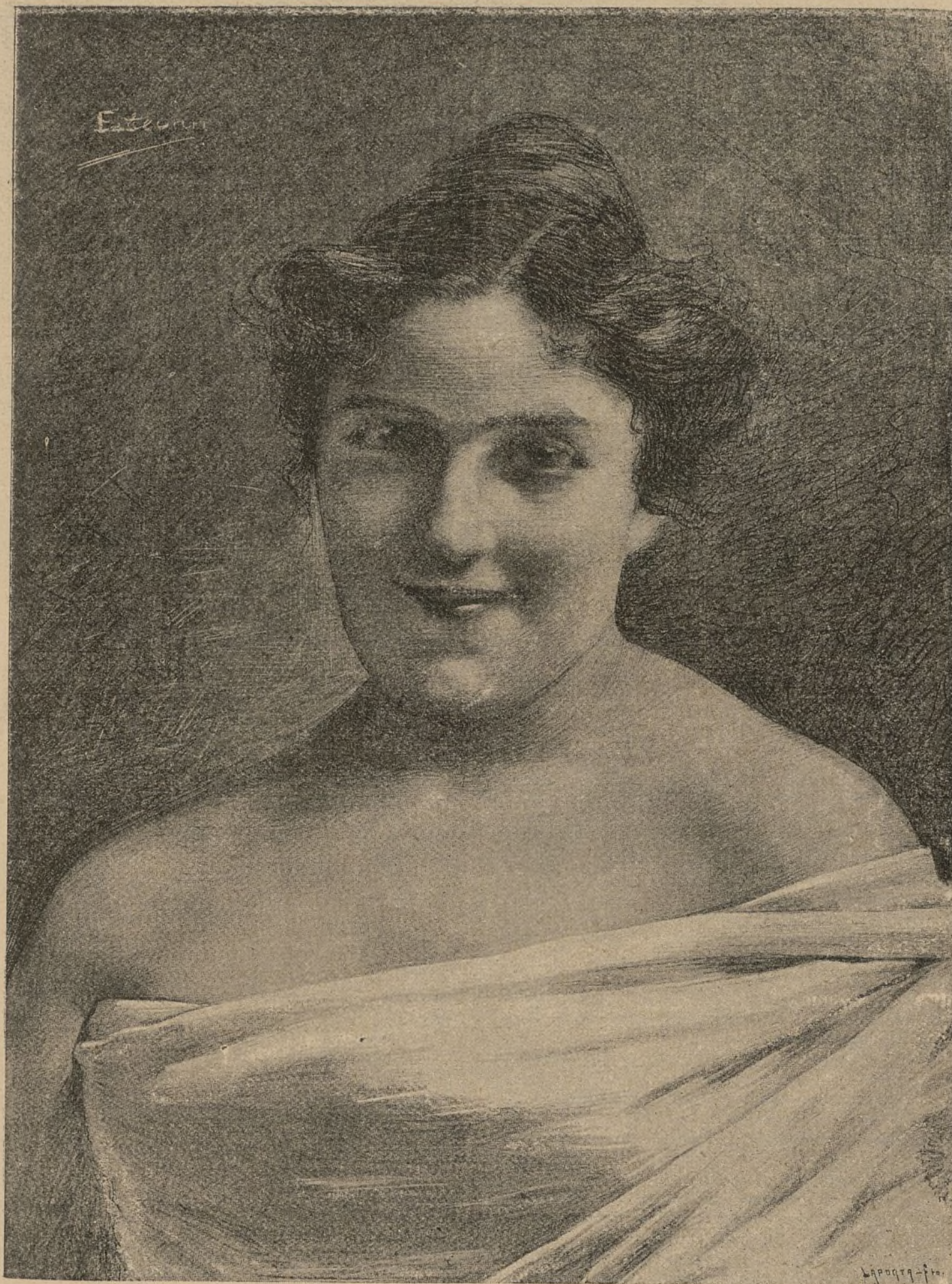
ESTUDIO DEL NATURAL (DIBUJO DE D. ENRIQUE ESTEVAN)