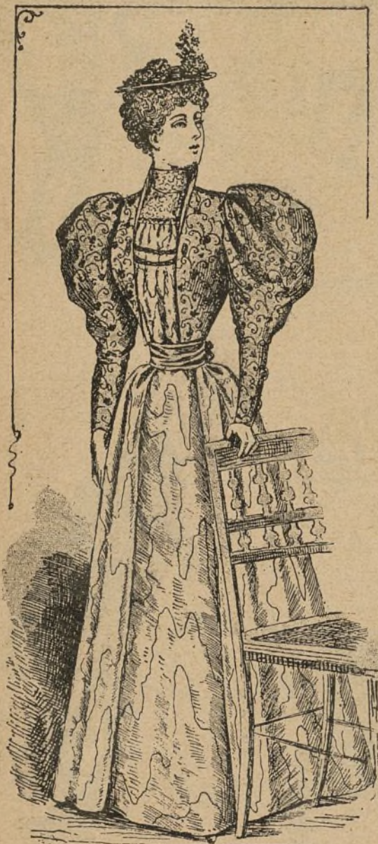
Núm. 1.—Traje de visitas.