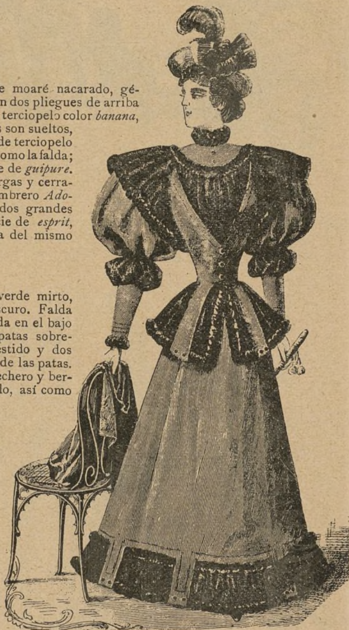
Núm. 2.—Traje de paseo.