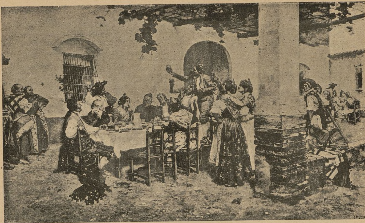
A LA SALUD DE LA NOVIA

(CUADRO DEL LAUREADO PINTOR D. JOAQUÍN AGRASOT)