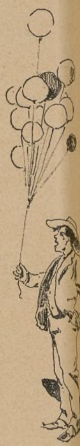
Tipo de feria