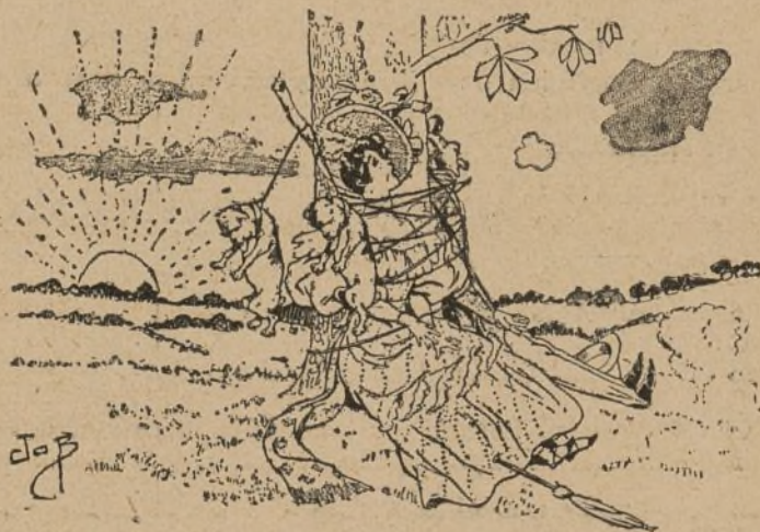
Y murieron solos.