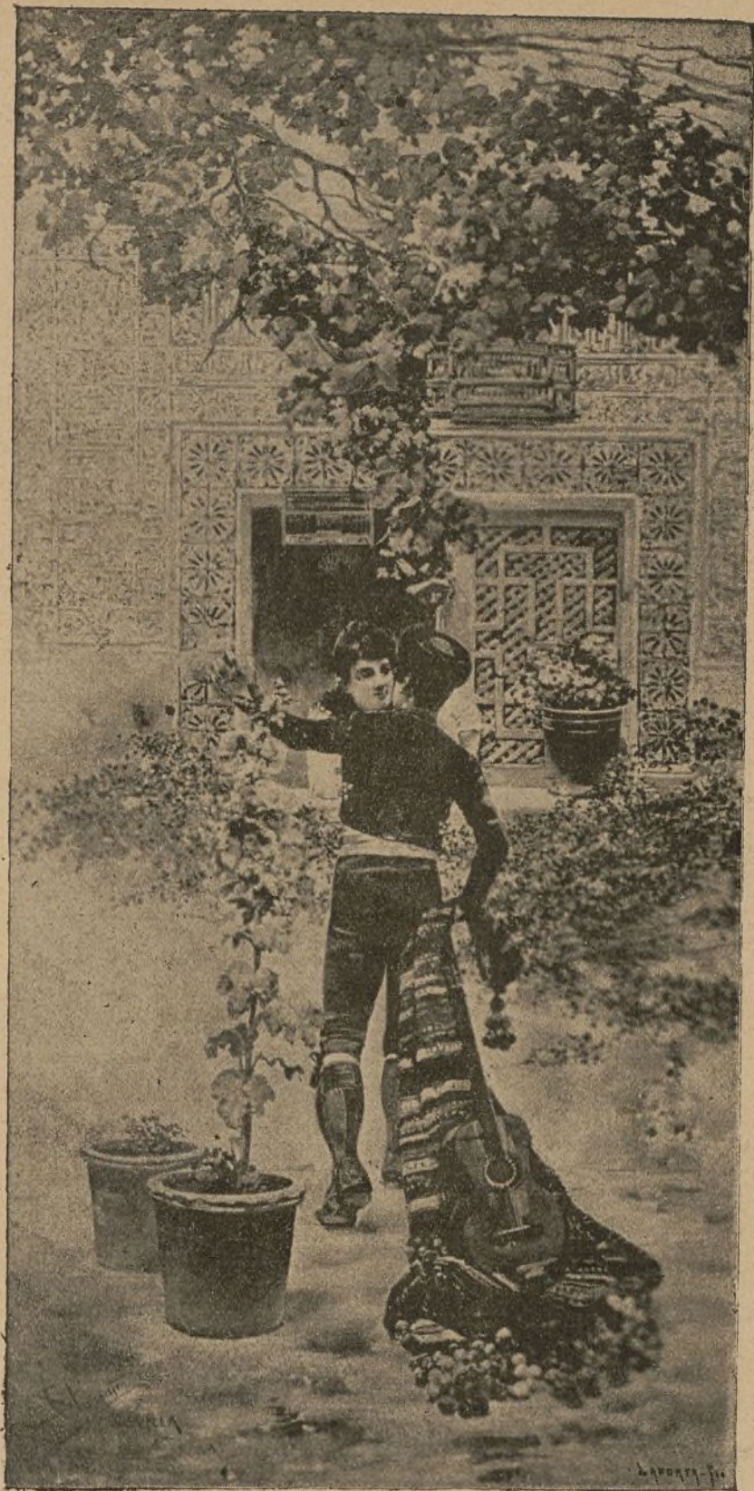
(Ilustración de D. Salvador Clemente.)

De una guitarra el tañido llega al arabesco nido donde se oculta la hermosa, y de una copla amorosa óyese el tono sentido.