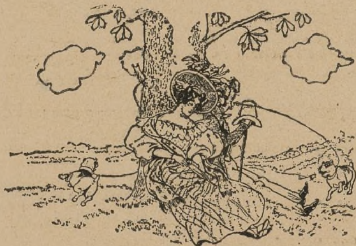
Se durmieron solos.