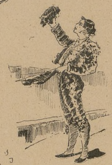
En la plaza.