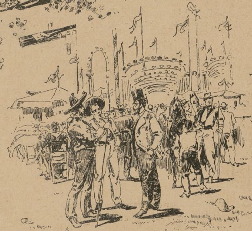
En el mercado.