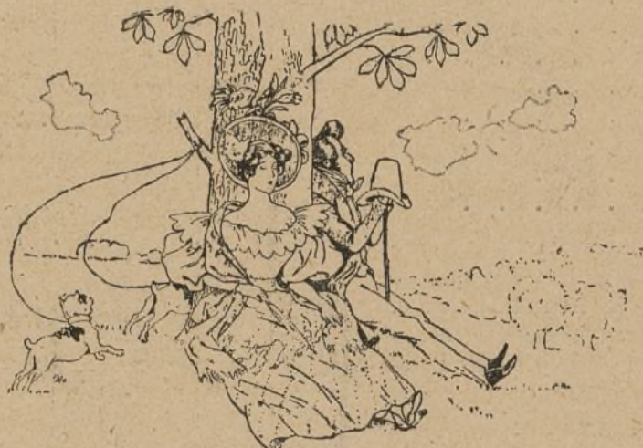
Se aburrieron solos.