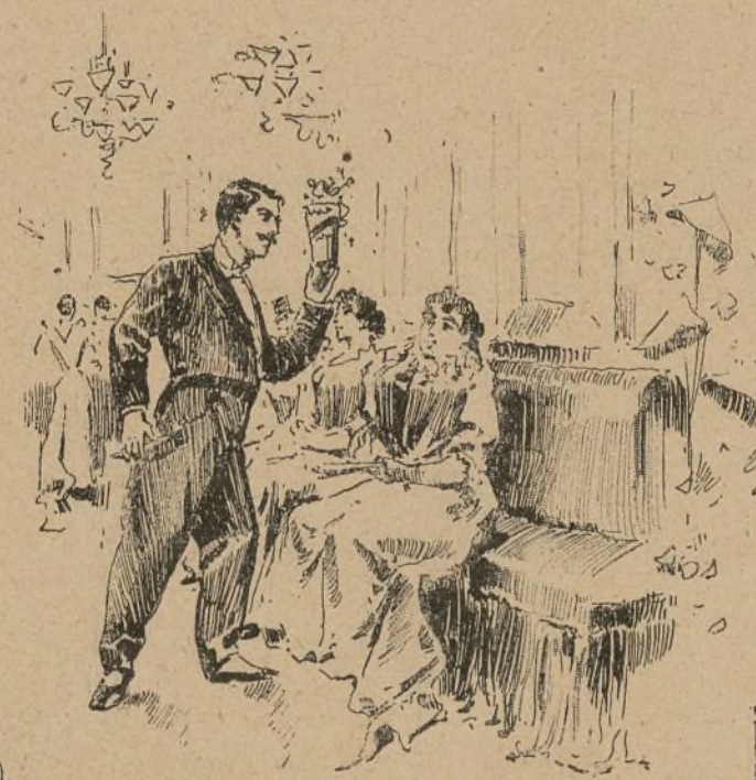
En la tienda del Cirulo.