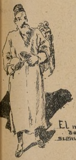
El moro de siempre.