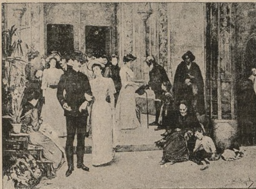
SALIDA DE MISA