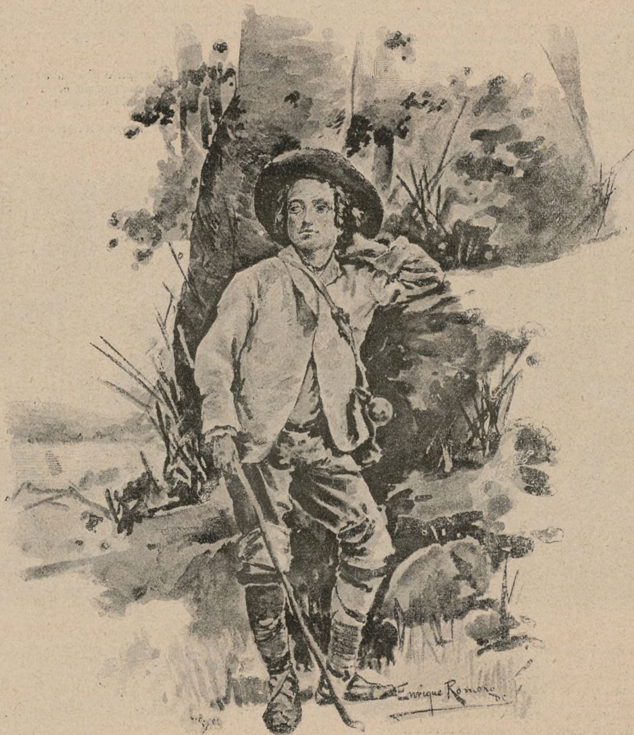
COMPOSICIÓN Y DIBUJO DE E. R. DE TORRES.