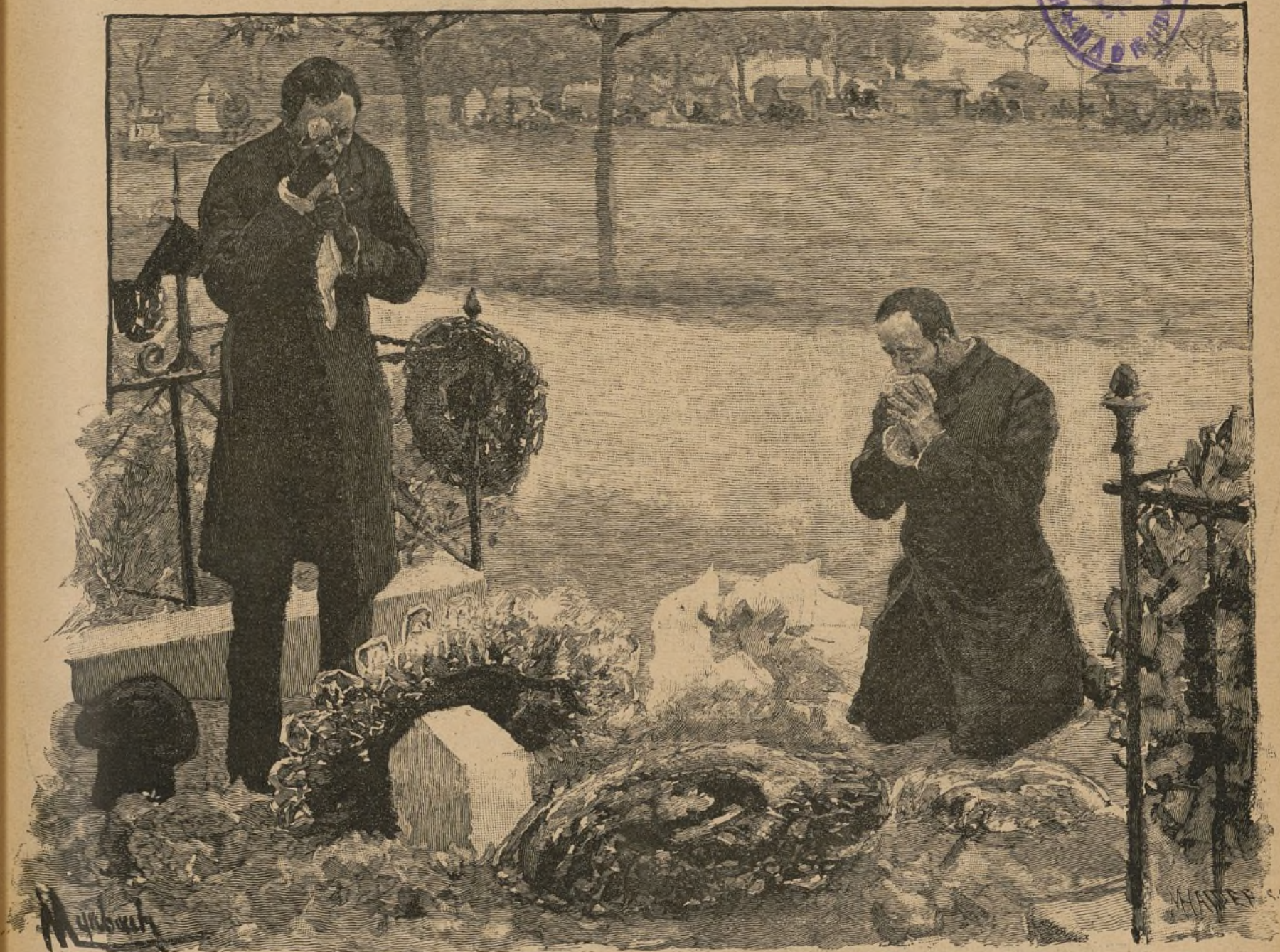
UNA ESCENA EN EL CEMENTERIO