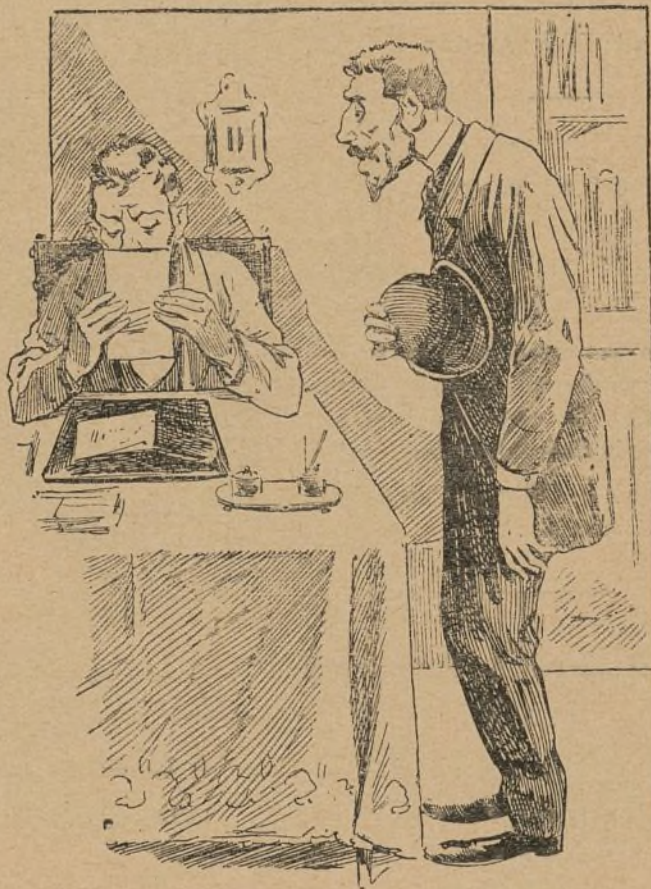
EN EL REGISTRO CIVIL

Estos periódicos no dicen nada interesante: esta es la hora en que no sé si las corbatas crema van a ser más elegantes que las heliotropo, para los ternos de mañana.