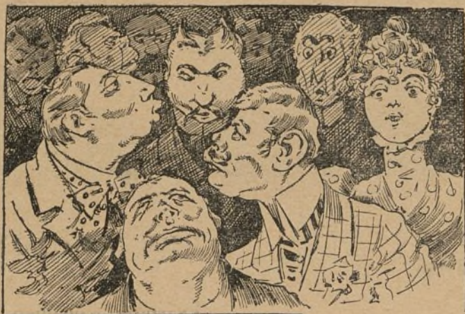
EN EL PARAISO DEL REAL

¡Y éste es el paraíso! pues yo creo no será por los ángeles que veo.