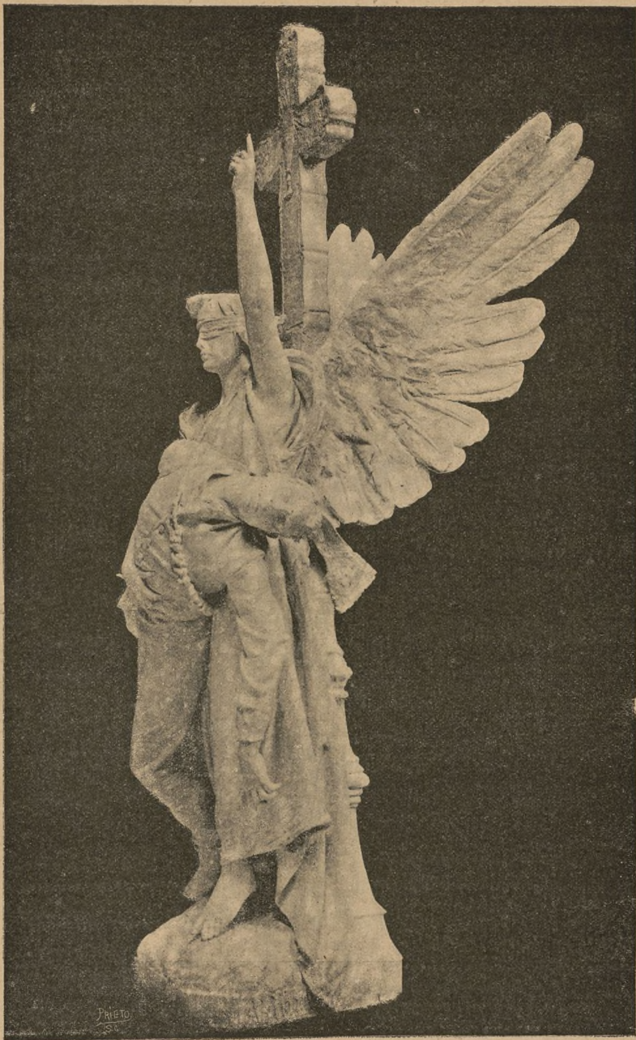
LA FE CONDUCIENDO A LA INMORTALIDAD LAS VÍCTIMAS DEL DEBER