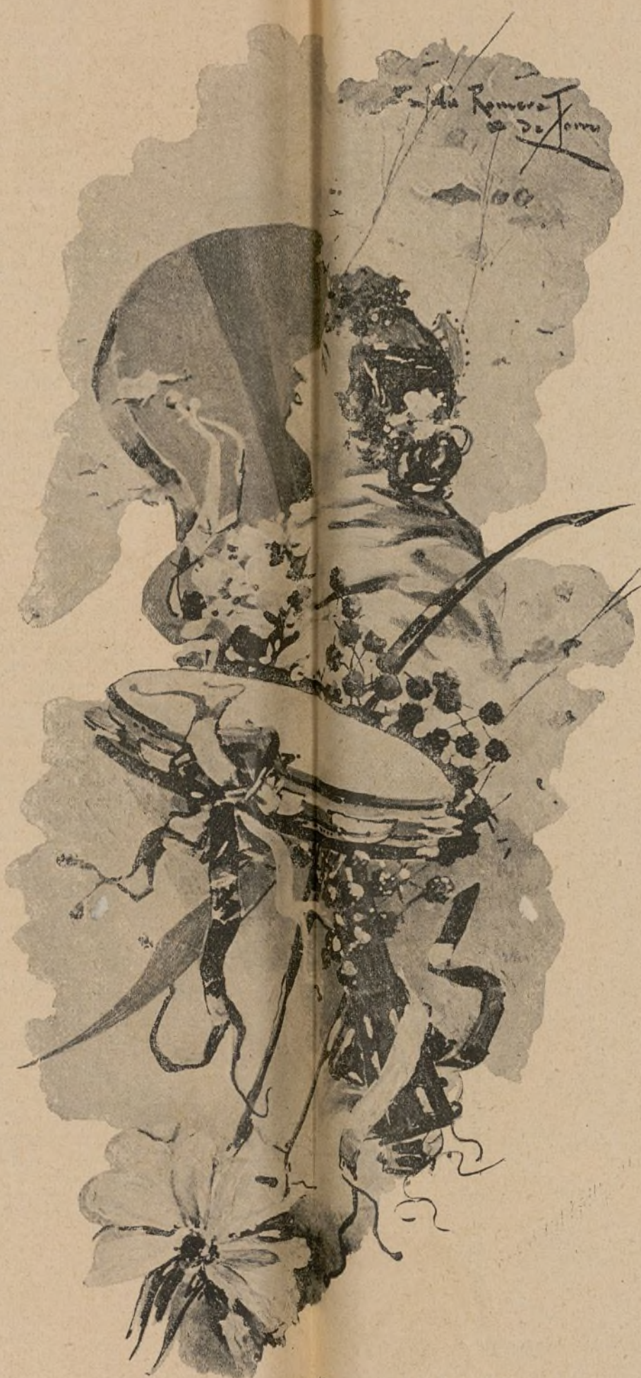
(Ilustración de Romero de Torres, J.)

En tu preciosa garganta he de clavar mi cariño, con muchos miles de besos como si fueran clavillos.