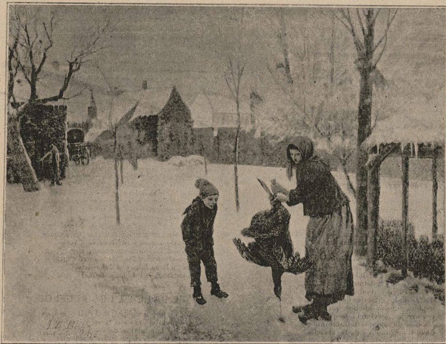
CUADRO DEL CÉLEBRE PINTOR FRANCÉS JULES BRETON