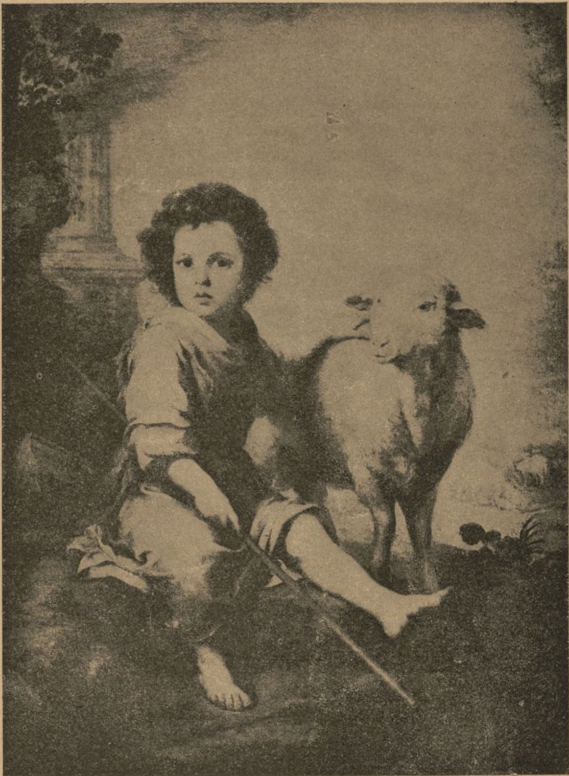
EL REY DE LOS NIÑOS