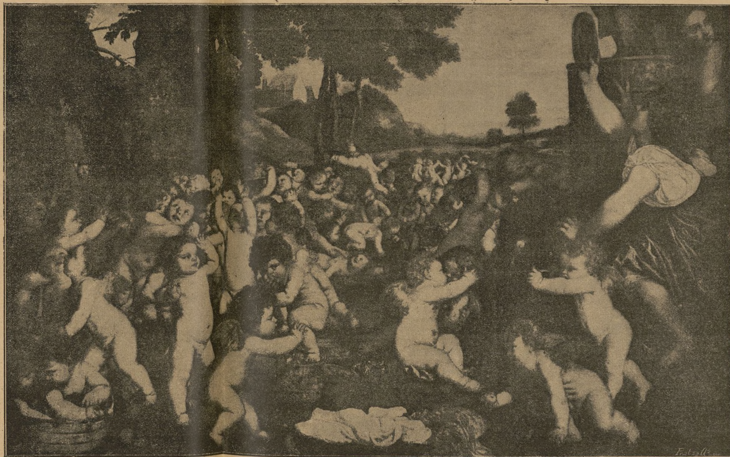
LA FECUNDIDAD.—CÉLEBRE CUADRO DEL TIZIANO.