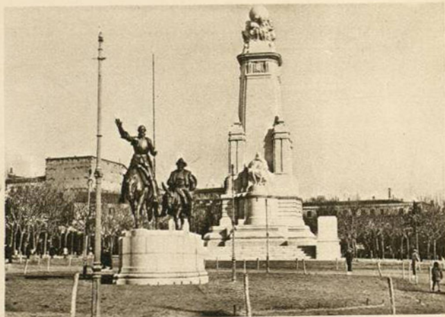
PLAZA DE ESPAÑA.—MONUMENTO AL QUIJOTE (Madrid)

La plaza de España y sus jardines están formados en los terrenos que ocupaba en la plaza de San Marcial el cuartel de San Gil. Era este edificio un convento de Gilitos, edificado en tiempos de Carlos III y que no llegó a ser habitado por la comunidad a que se destinaba. En el siglo XIX el cuartel de San Gil fué célebre por los sucesos del 22 de junio de 1866, que allí tuvieron su iniciación con dramáticos episodios. A fines de esa centuria el vasto caserón tenía también en su recinto el cuartel de la Escolta Real y Parque de Artillería.