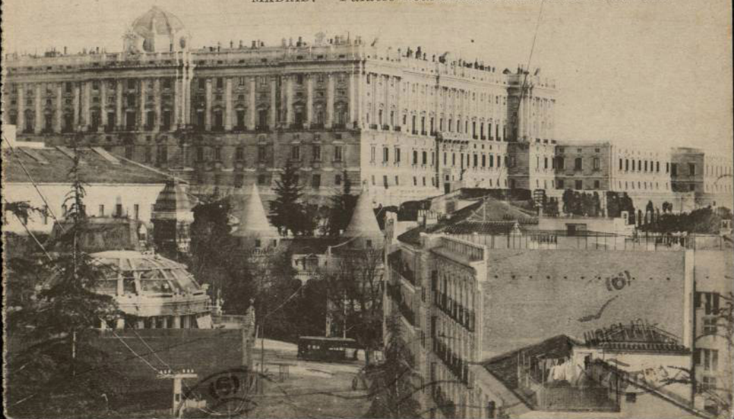
MADRID. — Palacio Real desde el cuartel de la Montaña.