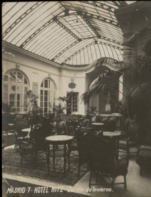
MADRID-7- HOTEL RITZ - Jardin de Invierno.