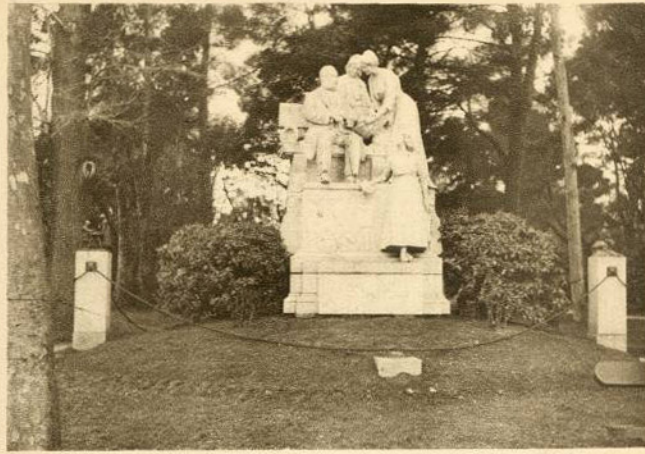
MONUMENTO A CAMPOAMOR (Madrid)

Los linderos del paseo de coches del Retiro han sido elegidos para emplazamiento de algunas estatuas de hombres célebres: Chapí, Martínez Campos, Campoamor y Galdós representan allí, desde la piedra o el bronce, diversos aspectos del siglo XIX en España.