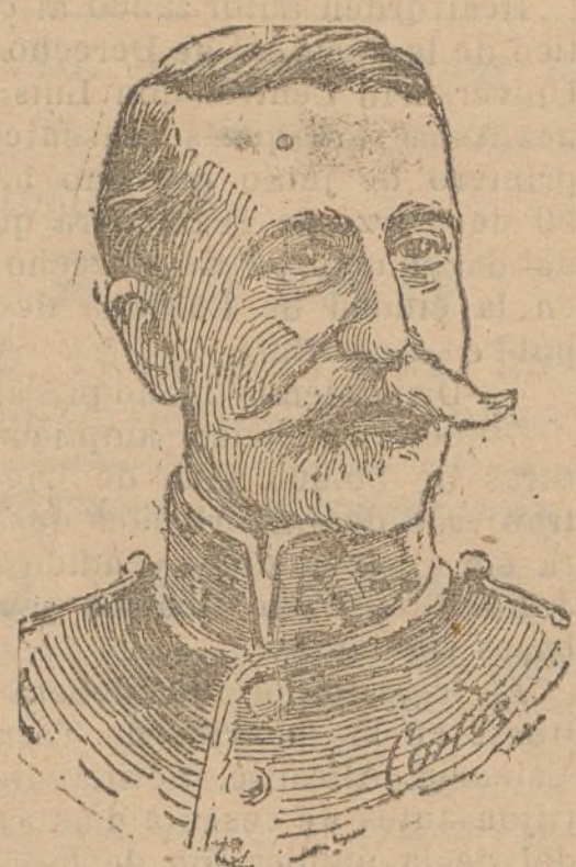
El Excmo. señor marqués de Comillas, don Claudio López Brú; que ha fallecido recientemente