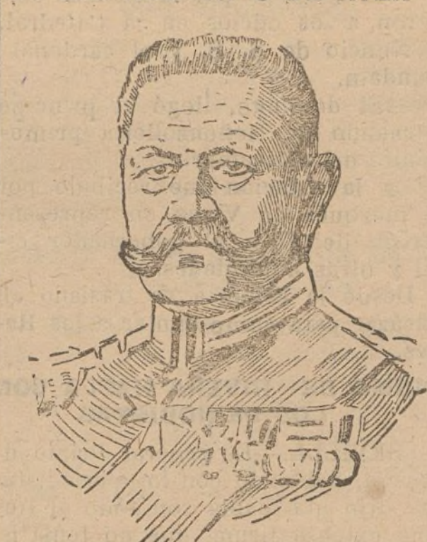
El general Hindenburg, candidato ultranacionalista, triunfante por 14 millones 600 mil votos