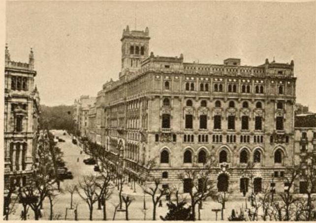
MINISTERIO DE MARINA (Madrid)

Al desaparecer los jardines del Buen Retiro, que antes fueron la Huerta de San Juan en el antiguo Real sitio, quedó, además del terreno que había de ocupar la Casa de Correos, una amplia extensión que permitió completar el trazado de dos vías anchurosas, construir grandes casas de vecindad, y dedicar un dilatado solar con fachadas al Prado, y a las calles de Montalbán y de Alarcón, para erigir el nuevo edificio del Ministerio de Marina.