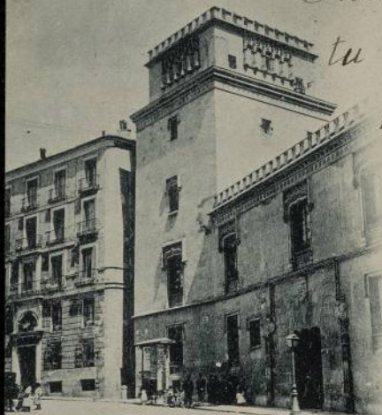
Nº 5. MADRID. TORRE DE LOS LUJANES.

Indudablemente tu hermosa sobri- na te tiene tan distraído que no te acuer- das de dar- nos noticias como te podía