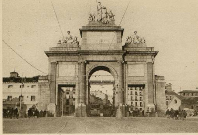
PUERTA DE TOLEDO (Madrid)

Aunque, como la de Alcalá, ha quedado aislada en el centro de una plaza y permanece por su carácter monumental como arco conmemorativo, se la sigue llamando puerta, lo mismo que cuando murado el recinto de la villa era éste uno de los accesos de la Corte.