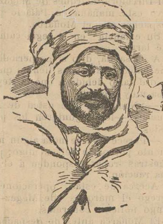
Mulay Mussuf, emperador de Marruecos, que ha entrado en Fez, en donde ha fijado su residencia.