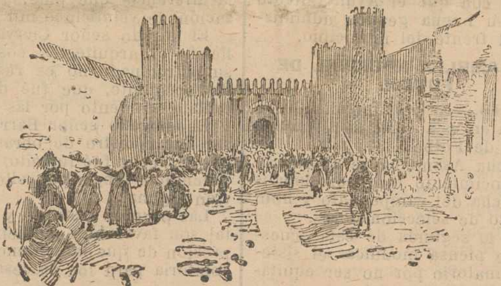
Puerta principal del palacio imperial de Fez, donde ha fijado su residencia el emperador Mu'ey Yussuf