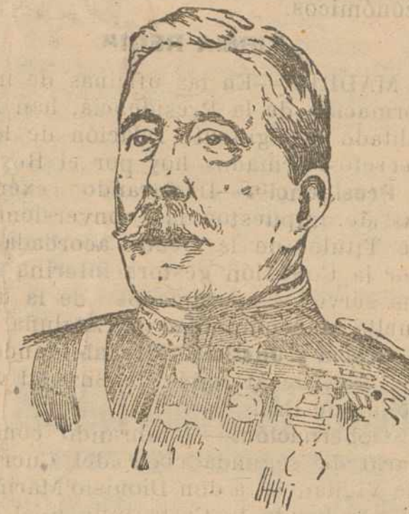
Don Antonio Tevar y Narceola, prestigioso general del Ejército español y ex-ministro de la Guerra, cuyo fallecimiento recientemente ocurrido en la Corte, significa una gran pérdida del país.