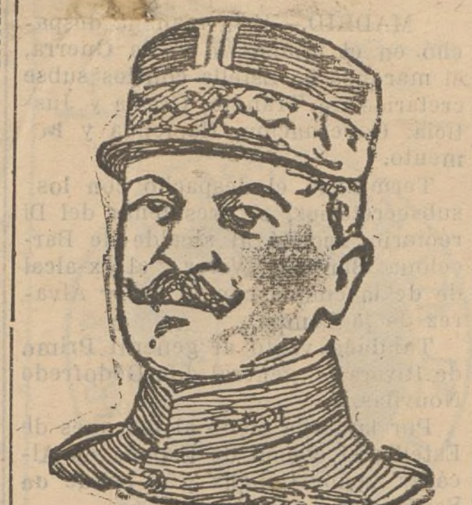
El general francés Nautin, nuevo je fe superior del Ejército de operaciones en Marruecos