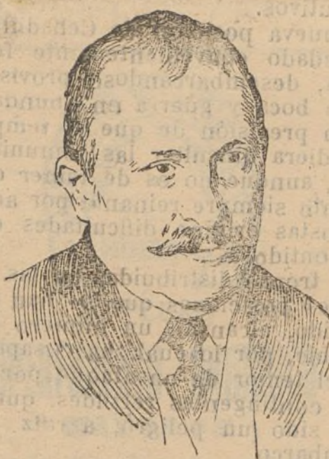
M. Renato Viviani, expresidente del Consejo de ministros de Francia, que ha fallecido en Plesis-Piquet, donde residía hace algún tiempo.