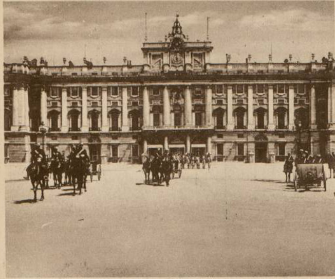
PLAZA DE LA ARMERIA. — RELEVO DE LA GUARDIA