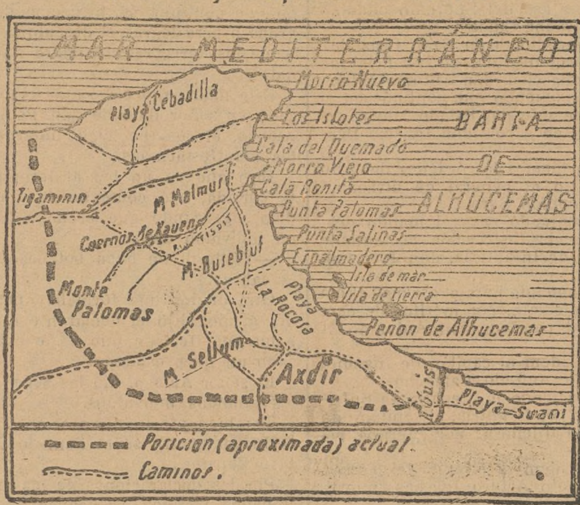
Gráfico de las últimas operaciones en Marruecos