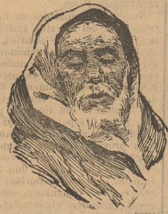
El célebre moro Bu. Beni-bu-Yagui que se sujeta a la M'Talza.