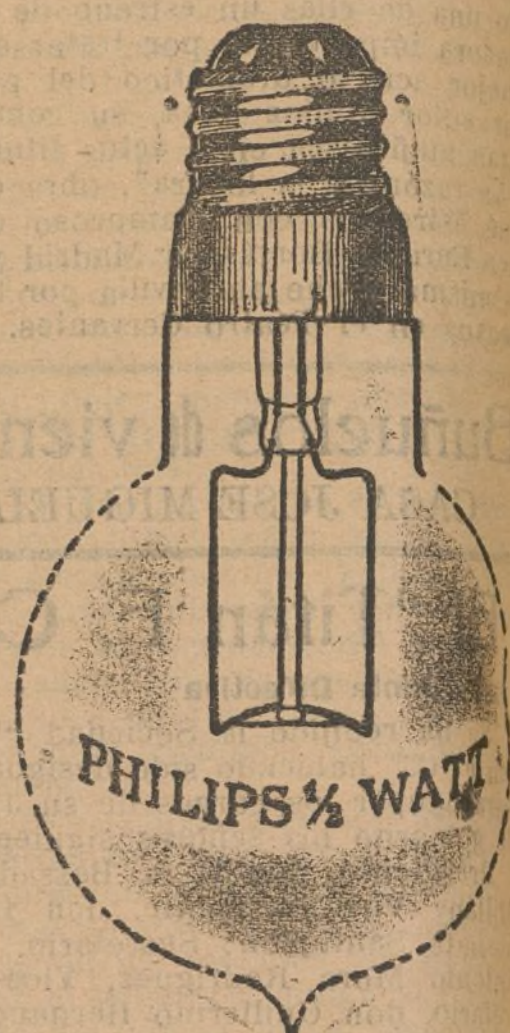
PHILIPS 1/2 WATT

COMERCIALES En los talleres de este DIARIO, encontraréis toda clase de trabajos tipográficos a precios sumamente económicos.