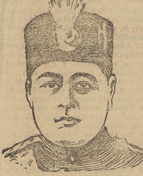
Amel-Chad-Kadjar, Sahad de Persia, que ha sido destronado por el presidente de su Gobierno Riza Khan, que se ha hecho proclamar Rey de Persia, adoptando el nombre de Phalavi