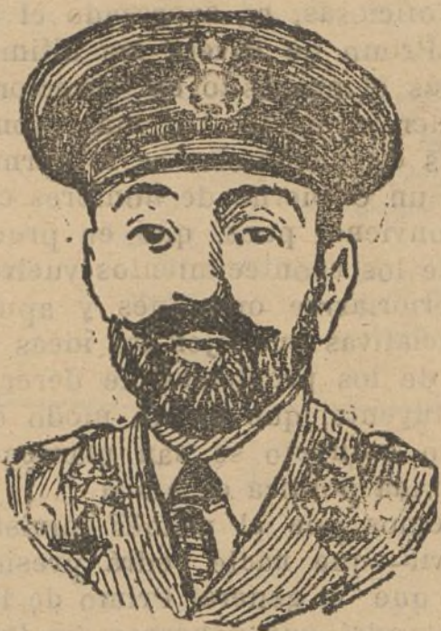
El general jefe del Estado Mayor del Ejército de operaciones en Africa, don Ignacio Despujols Sabaters, que ha sido nombrado general de la séptima división