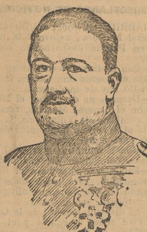
El general de división don Federico Berenguer y Fuste, nuevo comandante general de Ceuta.