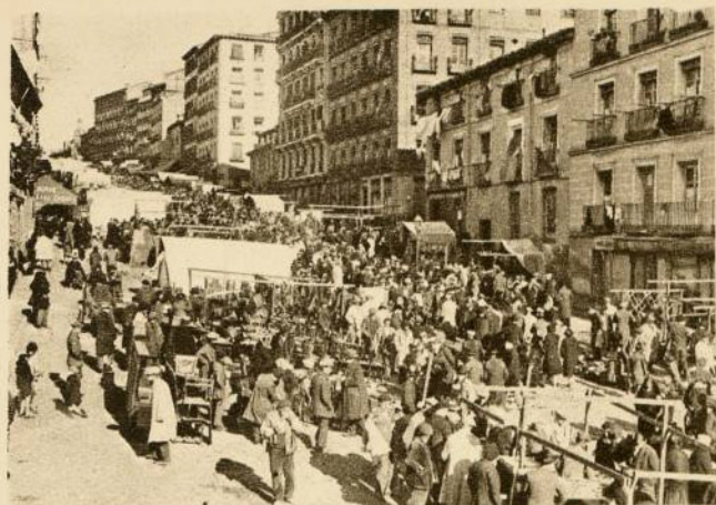
RUISSEAU DES TANNEURS (Madrid)