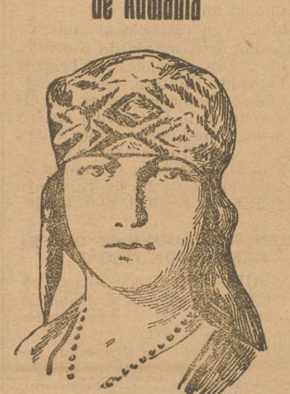
La princesita Ileana, de Rumania