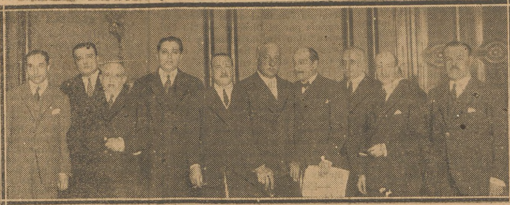
De izquierda a derecha: Sres. Yanguas (Estado); Calvo Sotelo (Hacienda); Ponte (Gracia y Justicia); Aunós (Trabajo); Martínez Anido (Gobernación); Primo de Rivera (Presidencia); Callejo (Instrucción); Cornejo (Marina); Duque de Te- tuán (Guerra) y Marqués de Guadalhorce (Fomento).