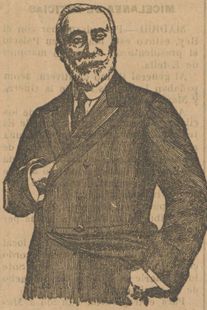
El expresidente del Consejo de ministros, don Antonio Maura y Moner, ilustre estadista que falleció repentinamente en Torrelodones, domingo último.