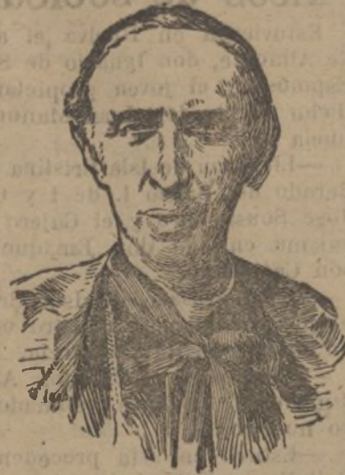
El venerable Cardenal belga, Mr. Mercier, que ha fallecido ayer tarde en Bruselas